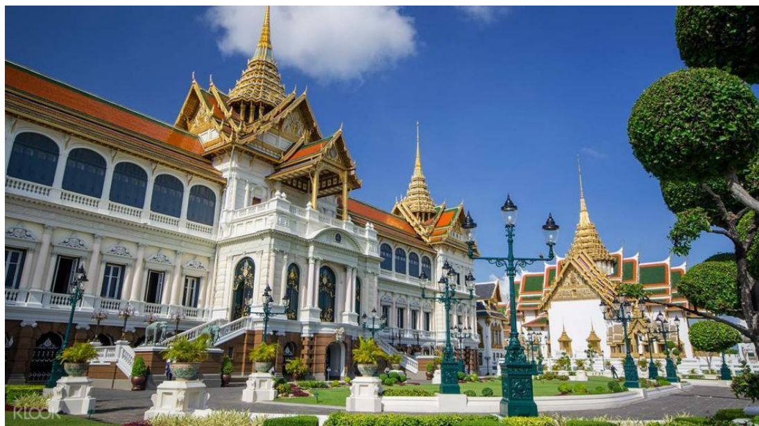
泰国著名景点大皇宫

2019年3月24日泰国举行新一届大选。7月10日，泰国王御准新一届内阁名单，7月16日全体阁员宣誓就职。现任内阁成员包括总理巴育·占奥差上将和6位副总理，以及外交、财政、交通等各部部长、副部长共34人。