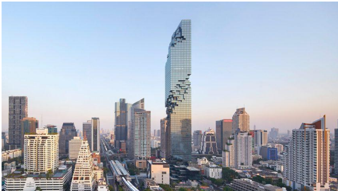
泰国最高建筑曼谷大都会大厦

首都曼谷位于湄南河畔，面积1569平方公里，人口约549万（截至2020年12月31日）。曼谷是泰国最大城市、东南亚第二大城市，也是泰国政治、经济、文化、交通中心。