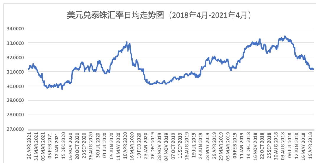
表 4-1 美元兑泰铢汇率变动趋势