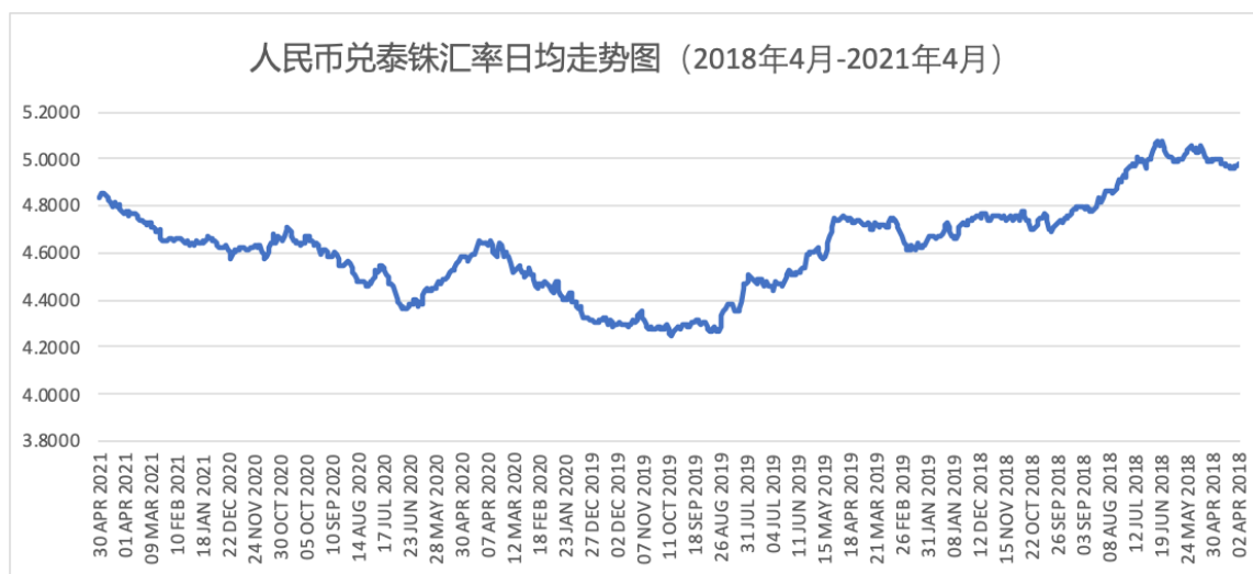
图 4-1 人民币兑泰铢汇率变化趋势