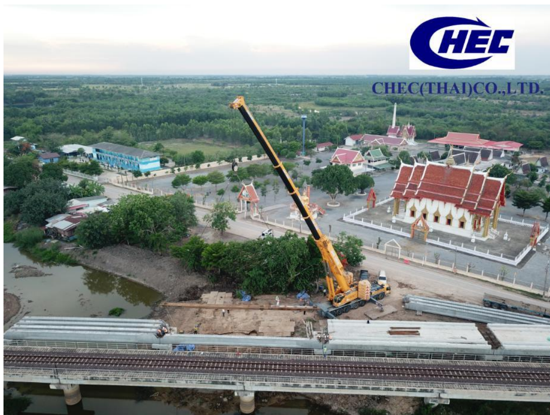
中国港湾（泰国）有限公司

截至目前，加入泰国中国企业总商会的承包工程企业增至47家，中国建筑股份有限公司、中国港湾工程有限责任公司、中国电力建设集团有限公司、中国铁建股份有限公司、中国中铁股份有限公司等多家具有国际竞争实力的中国企业均在泰国开展业务，主要涉及基础设施、电力工业、房屋建筑、石油化工等领域。