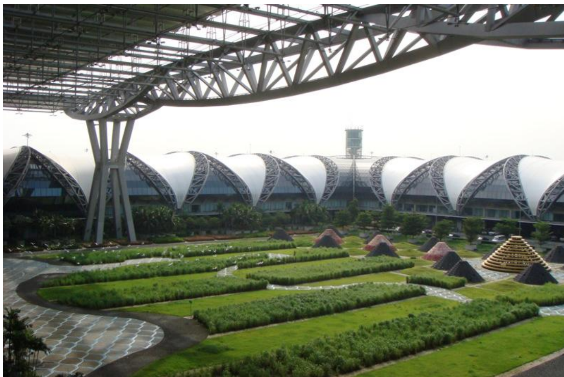
曼谷素万纳普国际机场

泰国航空业比较发达。航空客运已成为外国游客入境泰国的主要运输方式，乘飞机入境泰国的外国游客人数占入境泰国的外国游客总人数约80%。在货物运输方面，由于航空货运的费用较高，航空货运总额仅分别占国内货运比重和国际货运比重的0.02%和0.3%。